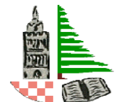
Istituto Professionale Agrario De Franceschi