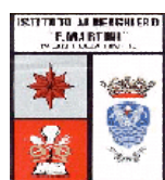
Istituto Alberghiero F. Martini