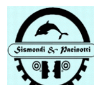
Istituto Sismondi & Pacinotti